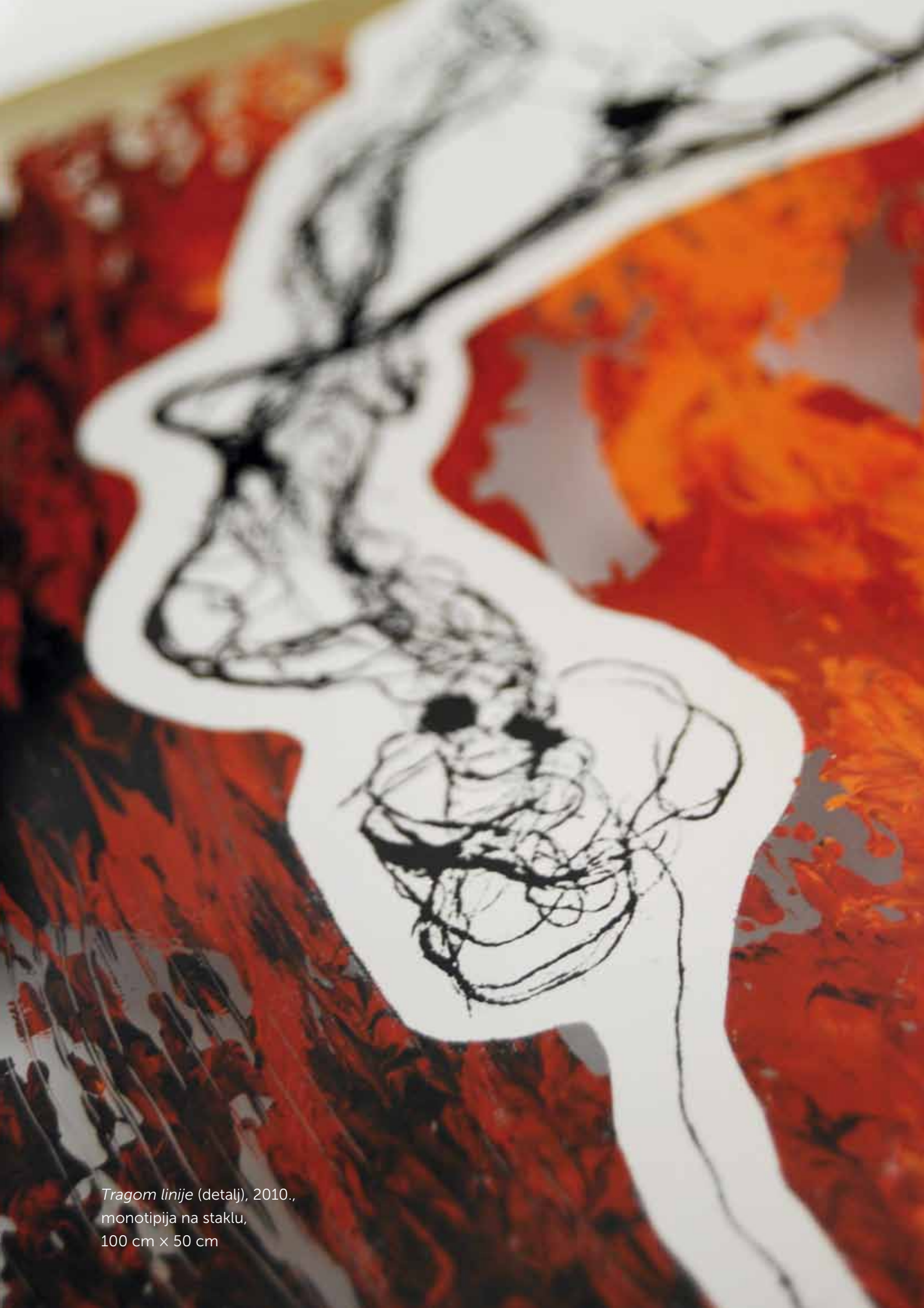
Tragom linije (detalj), 2010., monotipija na staklu, 100 cm x 50 cm