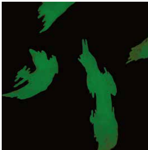
Dvostruke misli I, cjelina III, 2014. akvatinta, rezervaš, bakropis, suha igla, slijepi tisak, linorez, 490 x 490 mm, papir Hahnemühle, transparentna folija