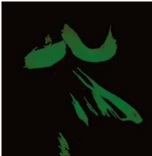
Prikriveni trag II , cjelina IV, 2014. linorez, slijepi tisak, 490 x 490 mm, papir Hahnemühle