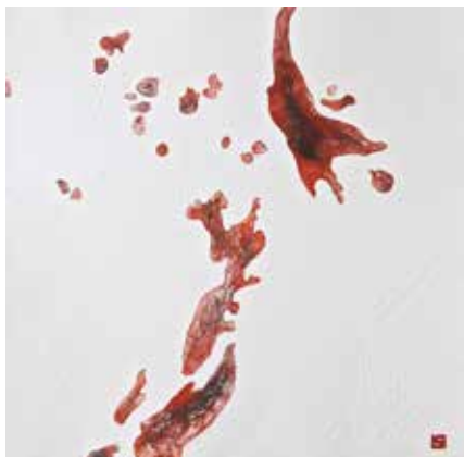
Igra boja i sjenki XIV , cjelina II, 2014. akvatinta, rezervaš, bakropis, suha igla, slijepi tisak, 490 x 490 mm, papir Hahnemühle