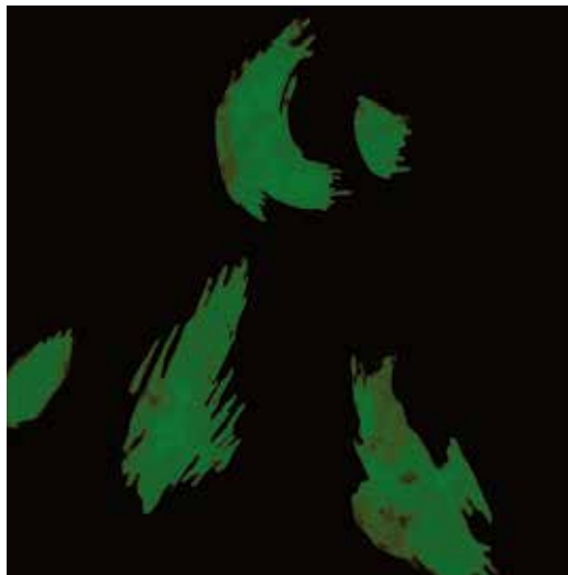
Dvostruke misli V , cjelina III, 2014. akvatinta, rezervaš, bakropis, suha igla, slijepi tisak, linorez, 490 x 490 mm, papir Hahnemühle, transparentna folija