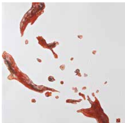
Igra boja i sjenki XII , cjelina II, 2014. akvatinta, rezervaš, bakropis, suha igla, slijepi tisak, 490 x 490 mm, papir Hahnemühle