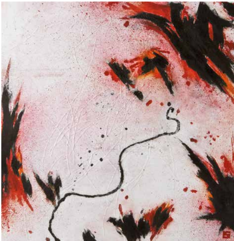
Put u prostor IV, cjelina I, 2014. akvatinta, reserlaš, bakropis, suha igla, slijepi tisak, 490 x 490 mm, papir Hahnemühle