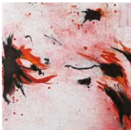
Put u prostor V, cjelina I, 2014. akvatinta, rezervaš, bakropis, suha igla, slijepi tisak, 490 x 490 mm, papir Hahnemühle