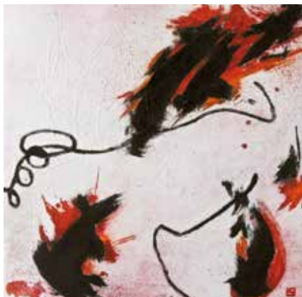
Put u prostor II, cjelina I, 2014. akvatinta, rezervaš, bakropis, suha igla, slijepi tisak, 490 x 490 mm, papir Hahnemühle