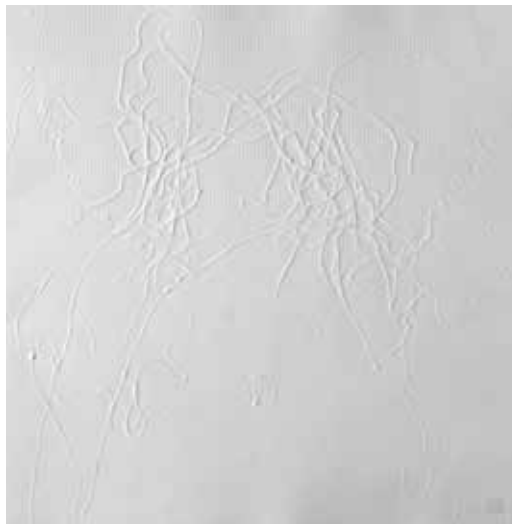
Potruga za sjenkom VII, cjelina V, 2014. slijepi tisak, 490 x 490 mm, papir Hahnemühle

Godine 2002. postaje članicom Hrvatskog društva likovnih umjetnika (HDLU), 2004. Udruge likovnih stvaralaca Zaprešića (ULSZ), a od 2005. godine nastupa kao samostalni umjetnik pod okriljem Hrvatske zajednice samostalnih umjetnika (HZSU). Svoj umjetnički izričaj predstavlja publici na mnogobrojnim samostalnim i skupnim izložbama u zemlji i inozemstvu te u okviru mnogih festivala.