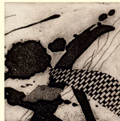
Kombinirana tehnika - "Misli i vizije"