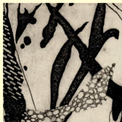
Kombinirana tehnika - "Odjeci prošlosti"