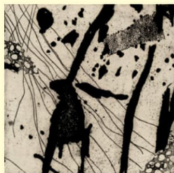
Kombinirana tehnika - "Fraktali zbilje"