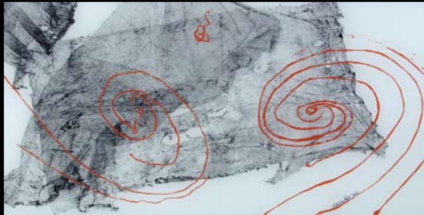
Polifonija / monotipija na staklu / 100 cm x 50 cm / 2007.