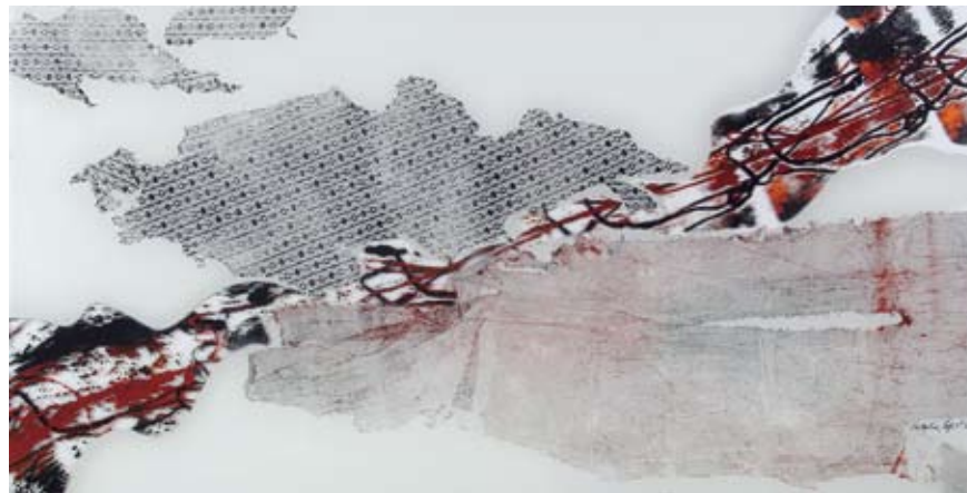
Spajanje i razdvajanje / monotipija na staklu / 100 cm x 50 cm / 2007.