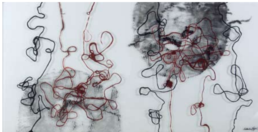
Vječni nemir / monotipija na staklu / 100 cm x 50 cm / 2007.