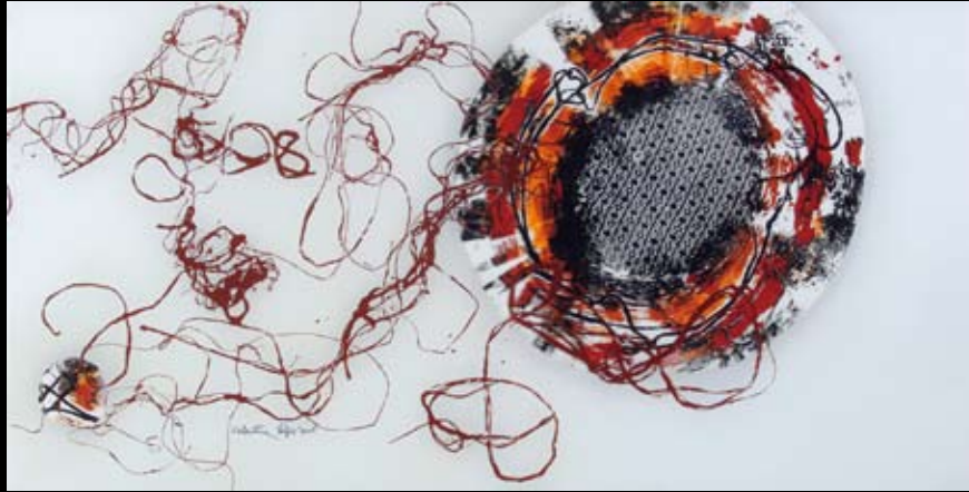
Koloplet / monotipija na staklu / 100 cm x 50 cm / 2007.

Kontakt: Valentina Šuljić Hvarska 10, 10000 Zagreb tel./fax: 01/61 87 918 mob.: 091/5229 661 e-mail: mona_vala@lycos.com mona_vala@yahoo.com web: www.monavala.com