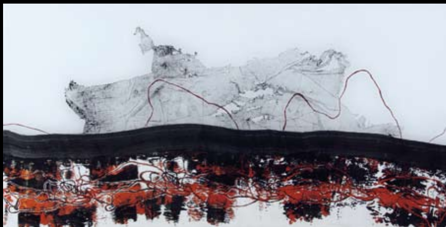
Suglasje niti / monotipija na staklu / 100 cm x 50 cm / 2007.